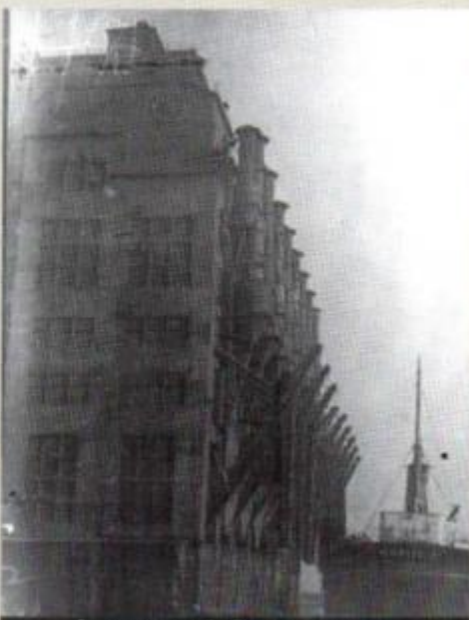
Замкнені кораблі біля зернового елеватора. Миколаївський порт. 1931 р.