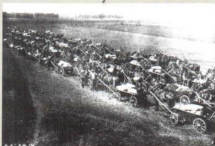
Червоний обоз з хлібом на пристанційному приймальному пункті. Гадяч. 1930 р.