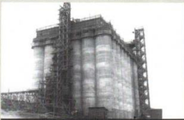
Загальний вигляд бурфінництва волинського елеватора. Херсон. 1932-1933 рр.

Заступник голови РНК СРСР В. Куйбішев Заст. керівника справами РНК СРСР І. Мехлаук