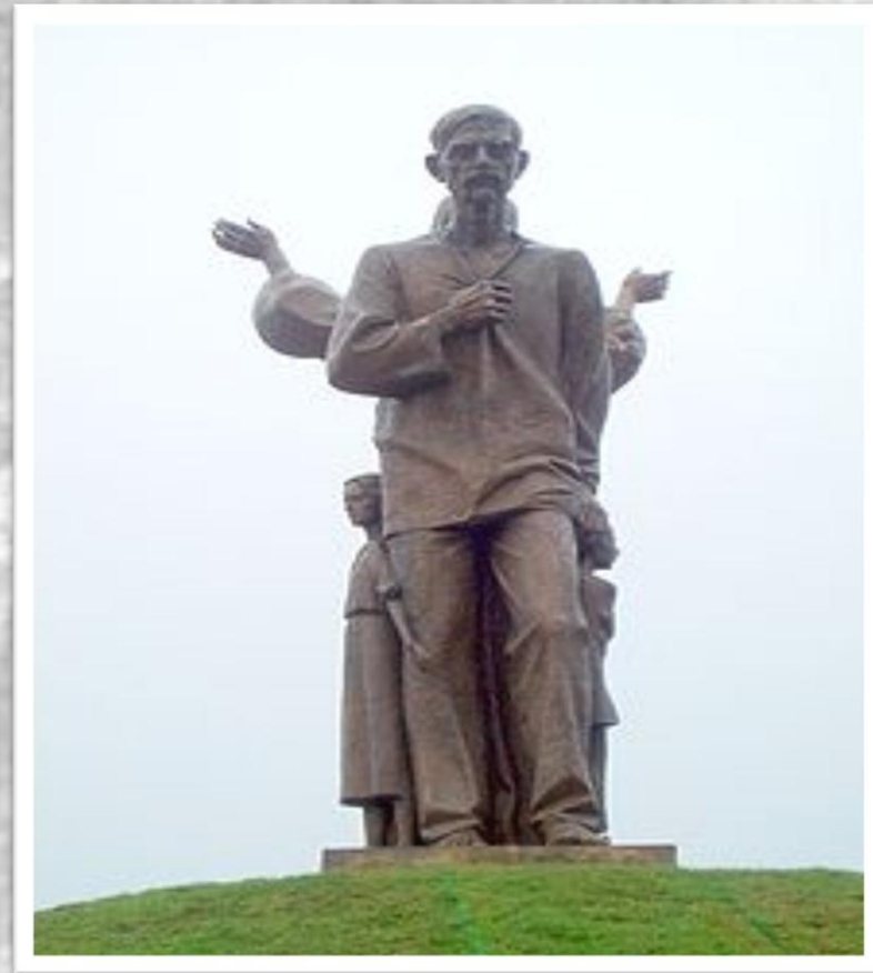
Український селянин, символічно намагається захистити свою сім'ю від голоду