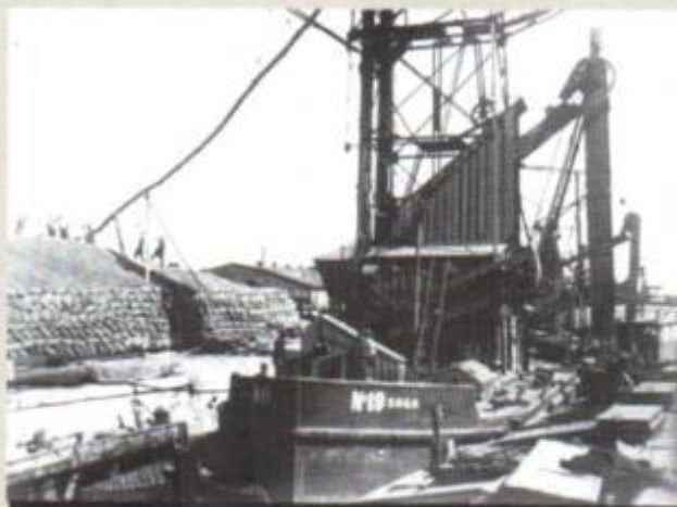
Плаваючий елеватор № 19. Херсонський порт. Вересень 1933 р.