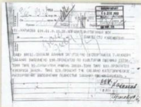
Телеграма В. Чубаря про виконання завдань з експорту хліба. Грудень 1932 р.

Експортуючи зернові культури за межі СРСР, режим відмовляється від зовнішньої допомоги, блокуючи на західних кордонах гуманітарну допомогу. Офіційно в країні відсутній голод.