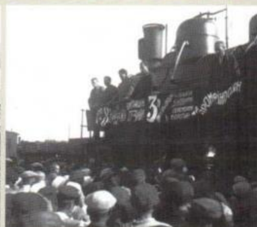
Відправлення ешелону з хлібом. Дніпропетровськ. 1932 р.