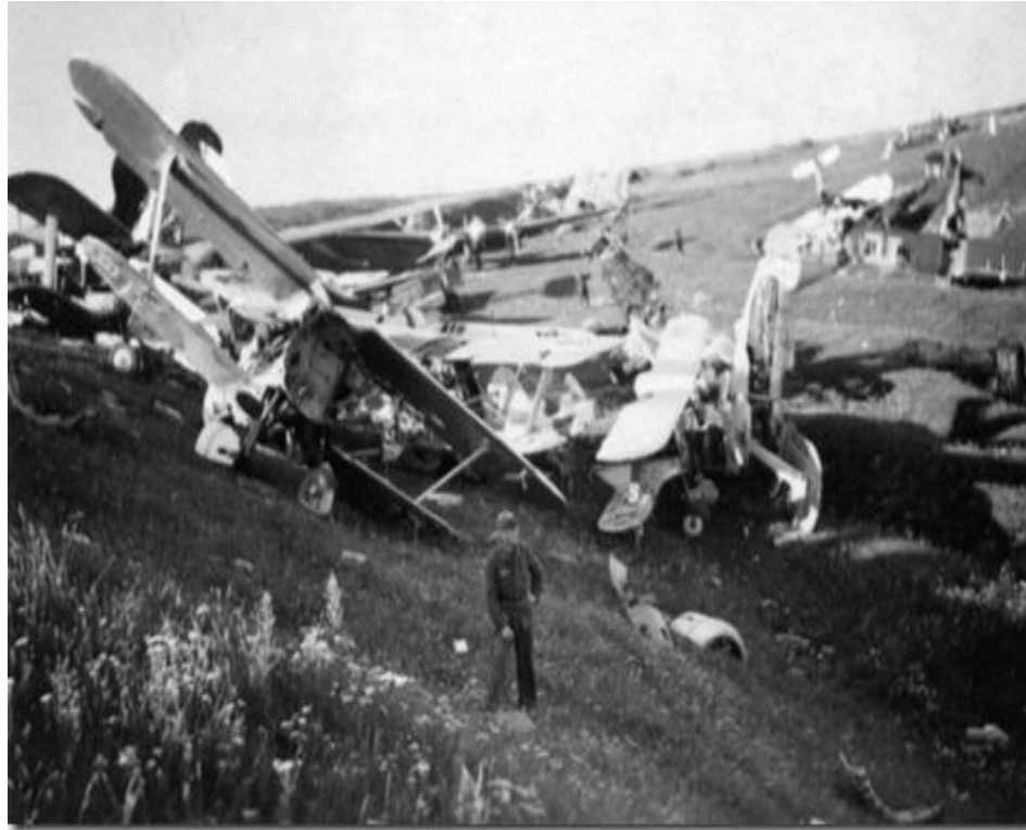
Знищення техніки СРСР